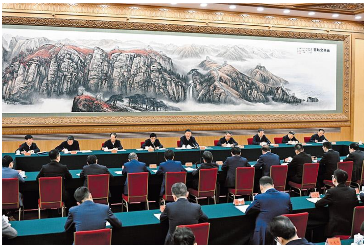
2025年2月17日，中共中央总书记、国家主席、中央军委主席习近平在京出席民营企业座谈会并发表重要讲话。

（2016年3月4日在参加全国政协十二届四次会议民建、工商联界委员联组会时的讲话）