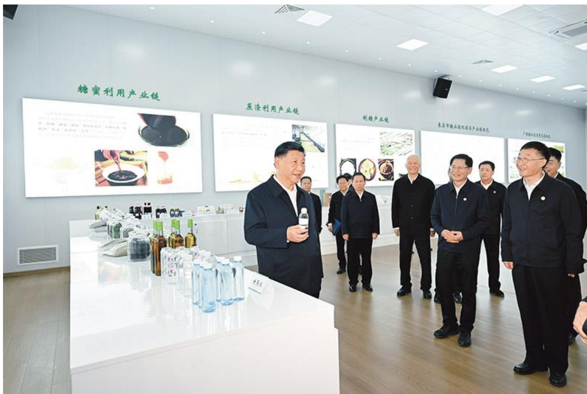
2023年12月14日至15日，中共中央总书记、国家主席、中央军委主席习近平在广西考察。这是14日下午，习近平在来宾东糖凤凰有限公司考察。