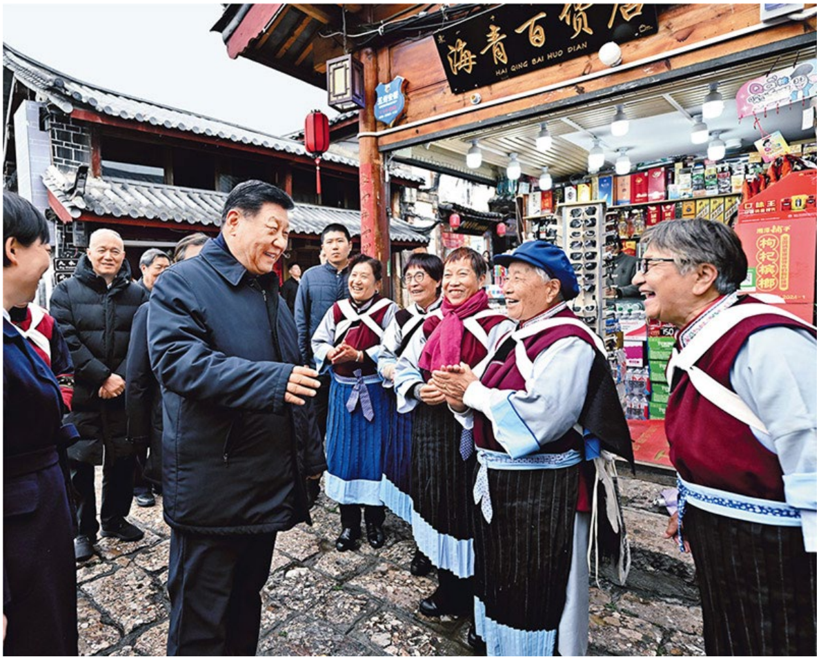
2025年3月19日至20日，中共中央总书记、国家主席、中央军委主席习近平在云南考察。这是19日下午，习近平在丽江古城考察时，与当地居民亲切交流。

第四，在创造性转化和创新性发展中赓续中华文脉。中华优秀传统文化凝结着中华民族绵延发展的基因和密码。高扬中华民族的文化主体性，把历经沧桑留下的中华文明瑰宝呵护好、弘扬好、发展好，是当代中国共产党人的历史责任和神圣使命。要坚持古为今用、推陈出新，坚持创造性转化、创新性发展，深入挖掘和阐发中华优秀传统文化的精神内涵，用马克思主义激活中华优秀传统文化中的优秀因子并赋予其新的时代内涵，发展新时代中国