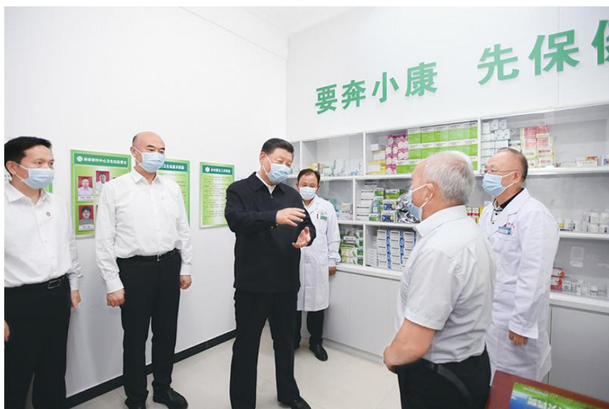
2021年9月13日至14日，中共中央总书记、国家主席、中央军委主席习近平在陕西省榆林市考察。这是14日下午，习近平在绥德县张家砭镇郝家桥村卫生站同村里的老人、医护人员亲切交流。

社会条件、文化特征不同，社会保障制度必然多种多样。我们注重学习借鉴国外社会保障有益经验，但不是照抄照搬、简单复制，而是立足国情、积极探索、大胆创新，成功建设了具有鲜明中国特色的社会保障体系。我们坚持发挥中国共产党领导和我国社会主义制度的政治优势，集中力量办大事，推动社会保障事业行稳致远；坚持人民至上，坚持共同富裕，把增进民生福祉、促进社会公平作为发展社会保障事业的根本出发点和落脚点，使改革发展成果更多更公平惠及全体人民；坚持制度引领，围绕全覆盖、保基本、多层次、可持续等目标加强社会保障体系建设；坚持与时俱进，用改革的办法和创新的思维解决发展中的问题，坚决破除体制机制障碍，推动社会保障事业不断前进；坚持实事求是，既尽力而为又量力而行，把提高社会保障水平建立在经济和财力可持续增长的基础之上，不脱离实际、超越阶段。我们要坚持和发展这些成功经验，不断总结，不断前进。