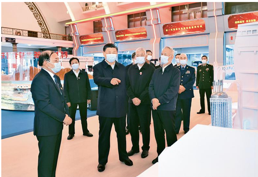
2021年10月26日，中共中央总书记、国家主席、中央军委主席习近平在北京展览馆参观国家“十三五”科技创新成就展。新华社记者 谢环驰/摄

当前，新一轮科技革命和产业变革突飞猛进，科学研究范式正在发生深刻变革，学科交叉融合不断发展，科学技术和经济社会发展加速渗透融合。科技创新广度显著加大，宏观世界大至天体运行、星系演化、宇宙起源，微观世界小至基因编辑、粒子结构、量子调控，都是当今世界科技发展的最前沿。科技创新深度显著加深，深空探测成为科技竞争的制高点，深海、深地探测为人类认识自然不断拓展新的视野。科技创新速度显著加快，以信息技术、人工智能为代表的新兴科技快速发展，大大拓展了时间、空间和人们认知范围，人类正在进入一个“人机物”三元融合的万物智能互联时代。生物科学基础研究和应用研究快速发展。科技创新精度显著加强，对生物大分子和基因的研究进入精准调控阶段，从认识生命、改造生命走向合成生命、设计生命，在给人类带来福祉的同时，也带来生命伦理的挑战。